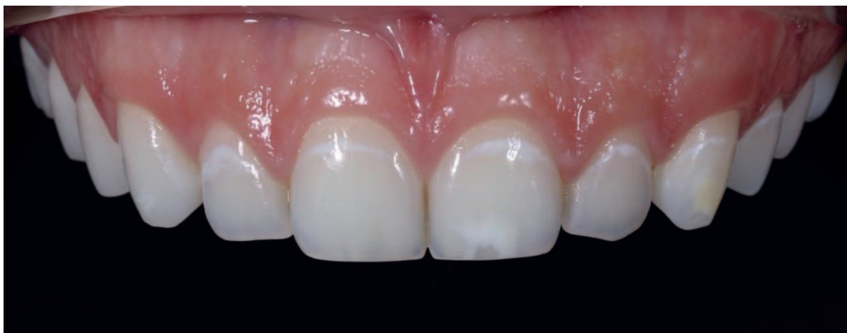
Figura 2. Vista frontal da arcada superior possibilitando a observação das manchas fluoróticas.

Considerando a idade do paciente recorreu-se às técnicas minimamente invasivas para mitigar as manchas fluoróticas utilizando a resina infiltrativa ICON ® (DMG,Germany) e o hipoclorito de sódio a 5%.