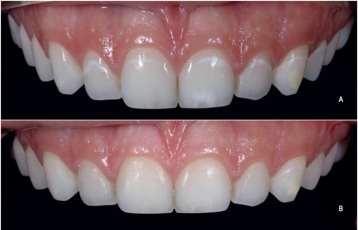
Figura 4. Vista frontal da arcada dentária superior antes do tratamento (A) e vista frontal da arcada dentária superior depois do tratamento (B).