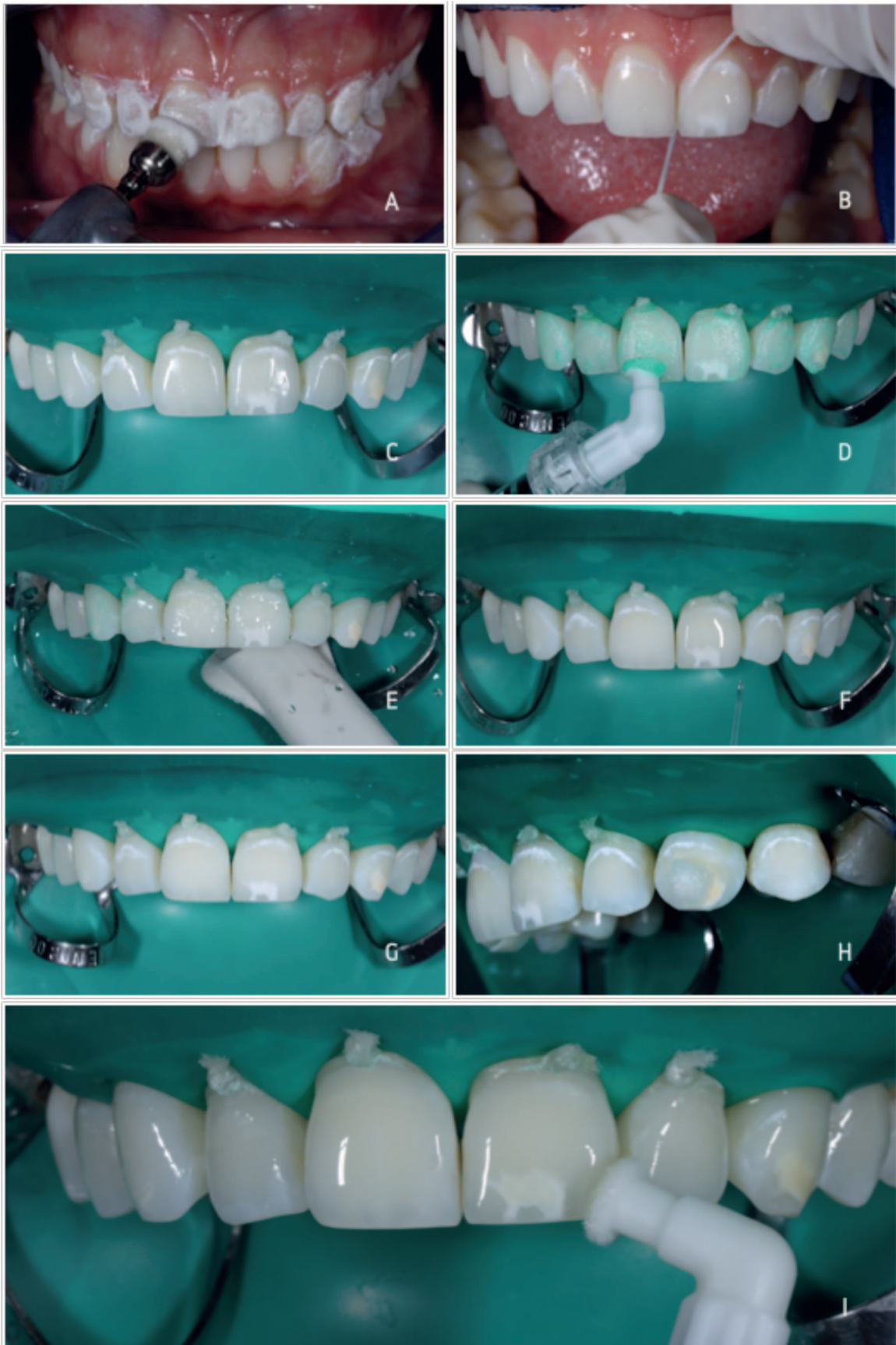
Figura 3. Procedimento ICON® (DMG, GERMANY): A - limpeza e polimento dentário usando escova profilática a baixa rotação e pasta de polimento; B - remoção de resíduos com fio dentário; C - realização do isolamento absoluto da arcada superior onde se realizará o tratamento; D - aplicação do ICON-Etch®; E - jato de água para remoção da solução aplicada anteriormente; F - aplicação do ICON-Dry®; G - observação das manchas fluoróticas nos dentes desidratados; H - aplicação de uma bola de algodão embebida em hipoclorito a 5% sobre o dente 23; I - aplicação do ICON-Infiltrant®.