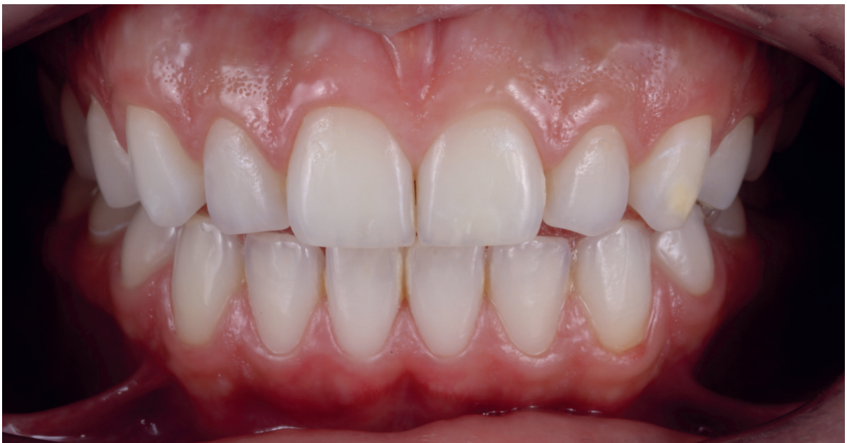
Figura 5. Follow up de 12 meses.