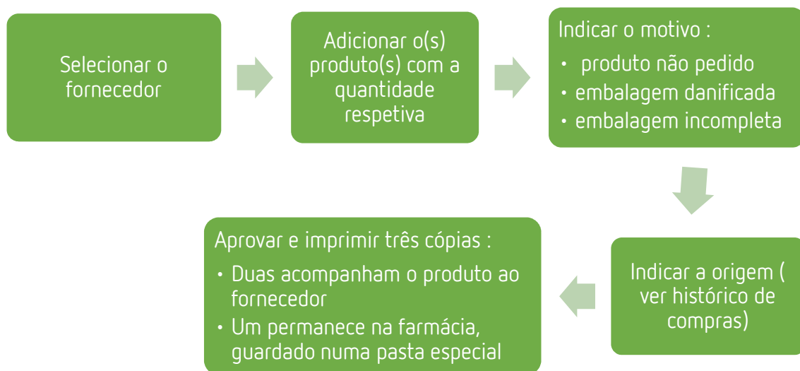
Figura 1 - Gestão de devolução

Os produtos separados são devolvidos ao fornecedor via Sifarma 2000, onde a seguinte figura é seguida para alcançar a devolução: