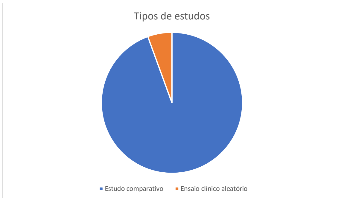
FIGURA 2: Distribuição dos estudos

Dos estudos selecionados, 16 são estudos comparativos (94.5%) e 1 estudo foi classificado como ensaio clínico aleatório (5.5%).